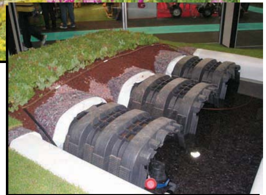
* Sistema para autoabastecimiento con aguas pluviales

El producto Top Sedum (tepe de sedum) está formado por una mall a compuesta de geotextil de poliéster de 100 gr/m 2 , fibra de coco , roca volcánica y una mezcla de 6 variedades de distintos sedums que garantizan una floración escalonada de mayo a septiembre.