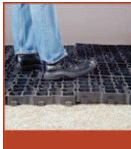
Encaje de placas