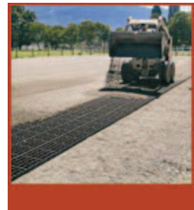
Relleno de la superficie de rejillas