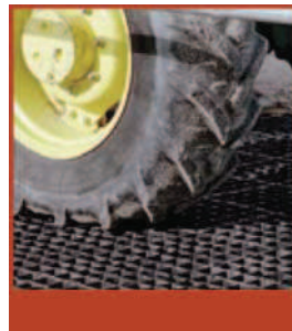
Una vez unidas pueden soportar la carga